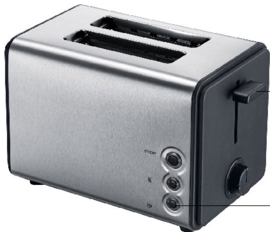
Ручка для подачі грінки Кнопка стоп Регулятор ступеню підсмажування Кнопка підігріву Кнопка розморожування